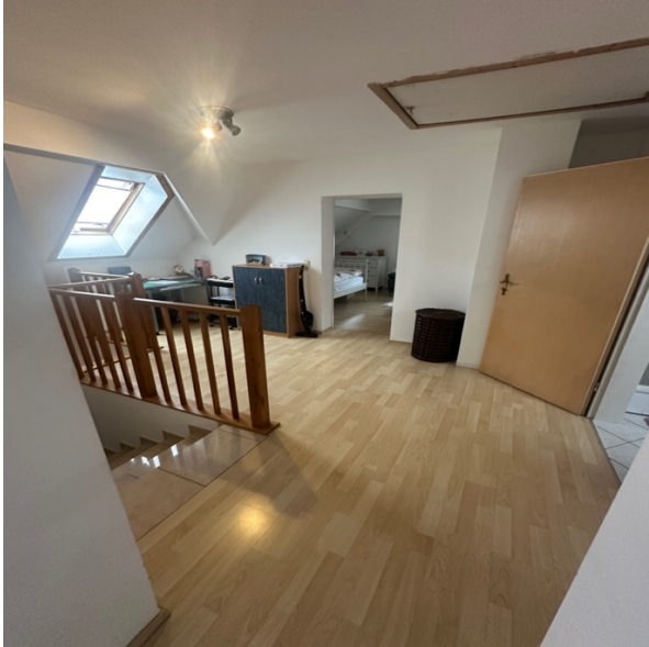
Blick in das Dachgeschoss