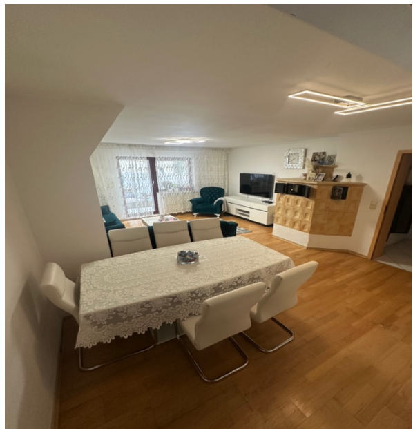
Ess- und Wohnzimmer mit Kachelofen